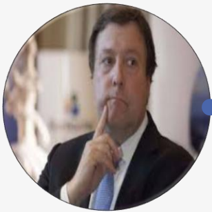
Alberto Weretilneck | Río Negro