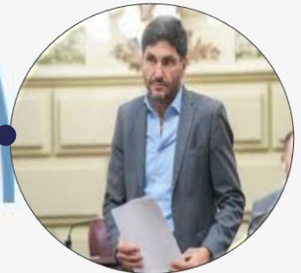
Maximiliano Pullaro | Santa Fe