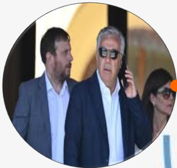
Alfredo Cornejo | Mendoza