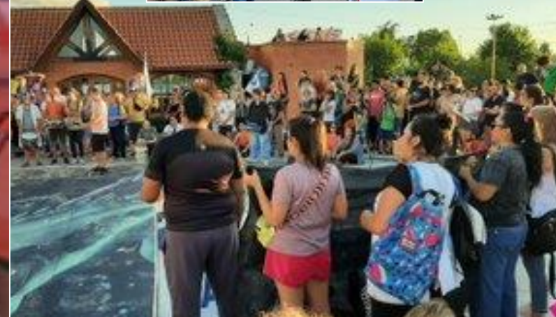
Trabajadores y trabajadoras de la Asociación de Profesionales y Técnicos de la Salud (APTS) reclaman salarios dignos y mejores condiciones laborales