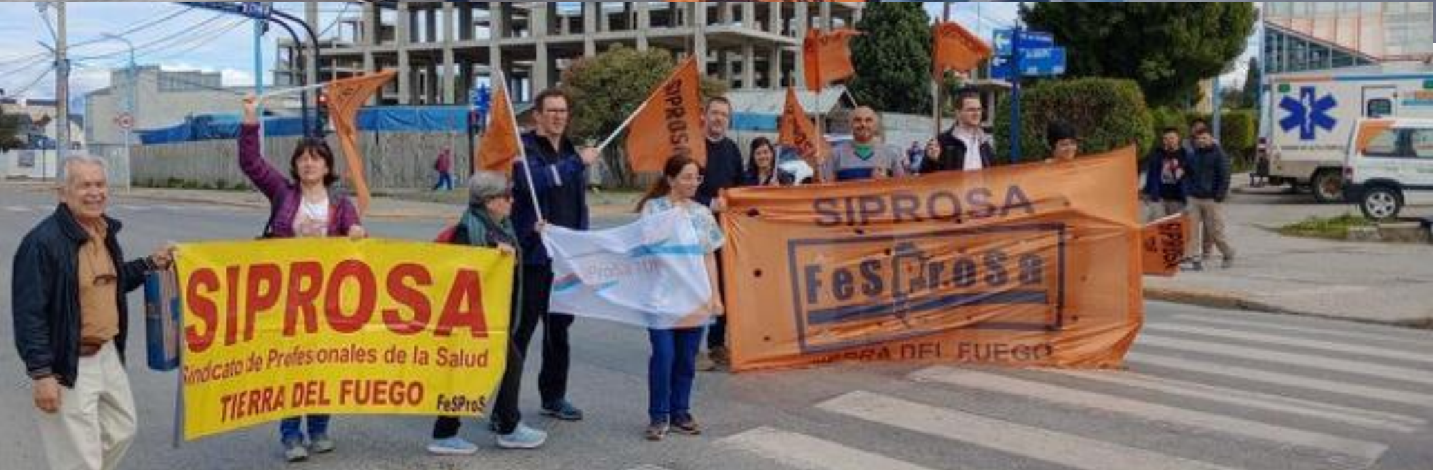
Movilización del Sindicato de Profesionales de la Salud de Tierra del Fuego (Siprosa)