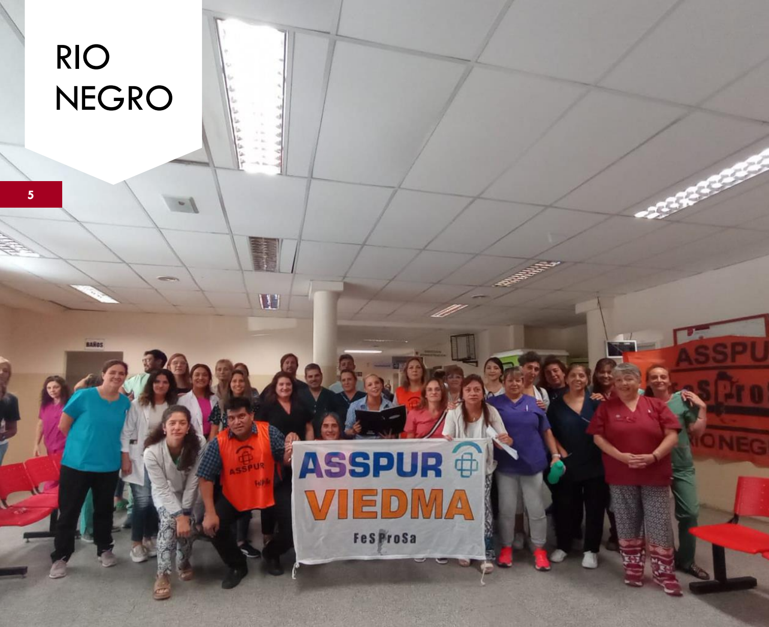
Medidas de fuerza de la Asociación Sindical de Salud Pública de Río Negro (Asspur) en Viedma y Bariloche