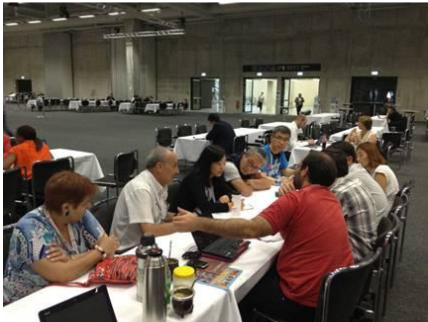
Reunión bilateral con la delegación de Corea del Sur con la que intercambiamos opiniones sobre los Sistemas Sanitarios de ambos países. Prometieron visitarnos en septiembre u octubre.