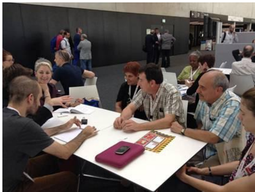
Reunión bilateral con la coordinadora de la delegación de Sindicatos Norteamericanos, quién se interesó por el modo y las posibilidades de financiamiento de los Gremios y sus Centrales, entre otros temas.