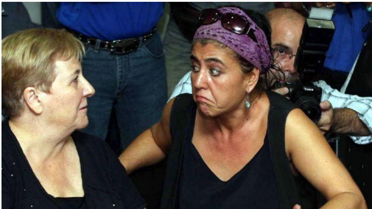
Del Pópolo (Ampros) y Blas (ATE) están al frente de las demandas de los gremios de la Salud. (Diego Parés)

Los gremios de la Salud y de la Administración Central intentarán hacer confluír sus reclamos, a cuatro semanas de las elecciones.