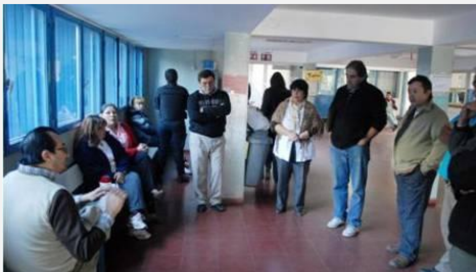
ASAMBLEAS. TRABAJADORES SE REUNIERON AYER EN ASAMBLEAS

EDICIÓN IMPRESA / Es posible que el Gobierno acerque una nueva propuesta, que se materializaría el próximo año.