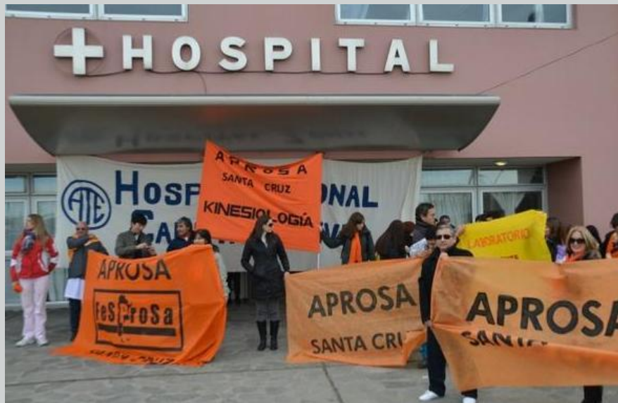
Medida de fuerza por 72 horas afectará la atención tanto en Caleta Olivia como Río Gallegos.