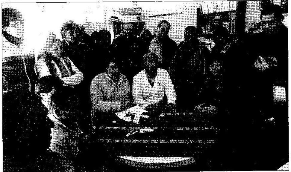
Dirigentes de Ate, Apuap, Apoc, Judiciales, Asep y municipales de Perico y San Pedro confirmaron que continuarán trabajando unidos para que se convoque nuevamente a negociación por la recomposición salarial 2013

Con este plenario buscan generar un espacio amplio de discusión para debatir la situación en que se encuentran y definir el curso de acción que asumirán en las próximas semanas.