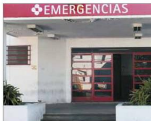
La guardia del Hospital San Juan de Dios, en condiciones insalubres