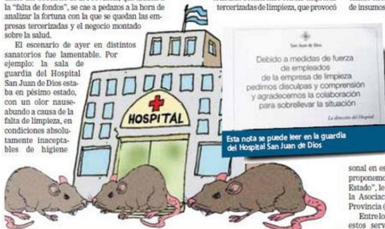
Esta nota se puede leer en la guardia del Hospital San Juan de Dios

Se trata de un personaje que desde hace años tiene vínculos con altos funcionarios de la Provincia y consigue así hacerse de onerosos contratos. Ha conformado un verdadero monopolio que factura cifras exorbitantes ( ver aparte ), al mismo tiempo que tiene a sus empleados bajo modalidades de contratación extremadamente precarias.